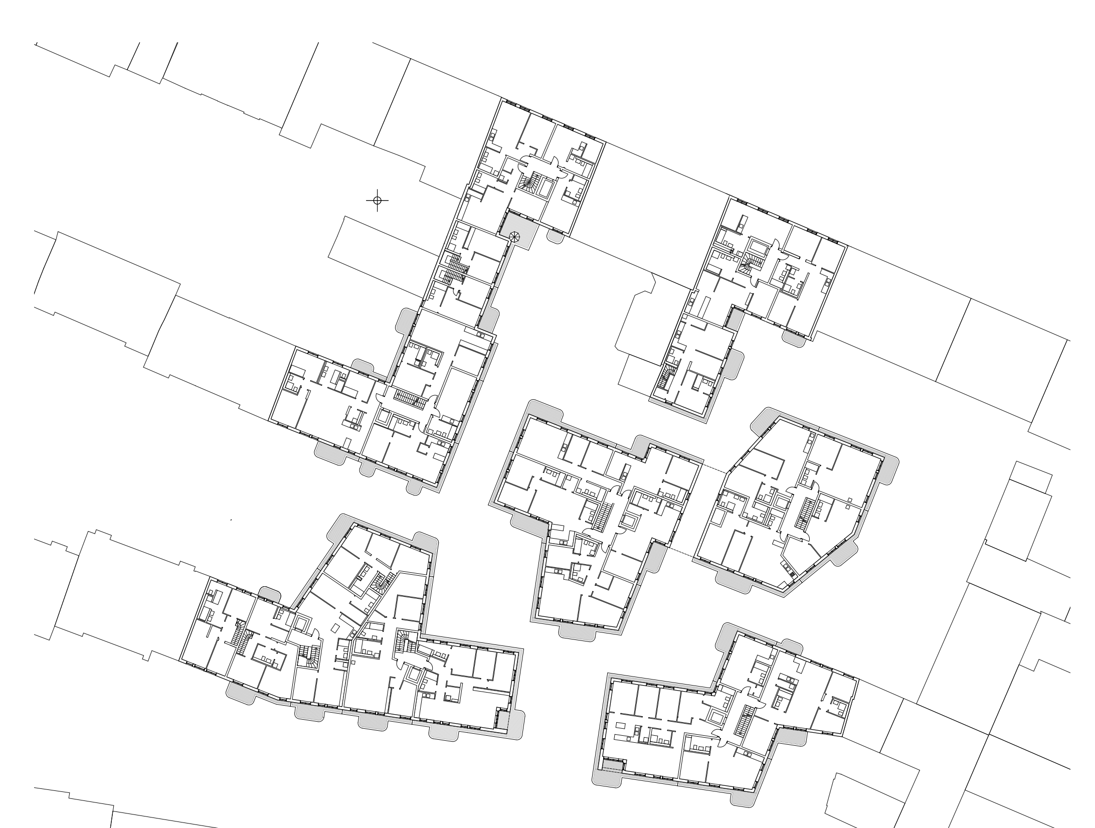
Lageplan | © Palais Mai Gesellschaft von Architekten und Stadtplanern mbH