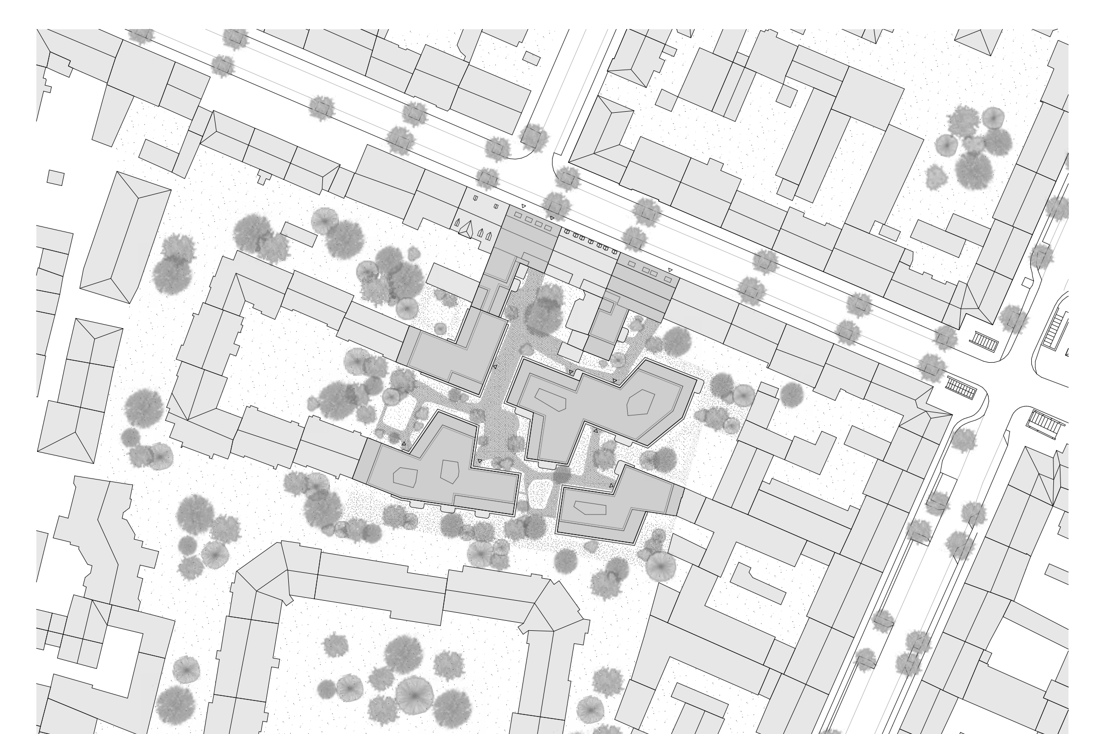
Lageplan | © Palais Mai Gesellschaft von Architekten und Stadtplanern mbH