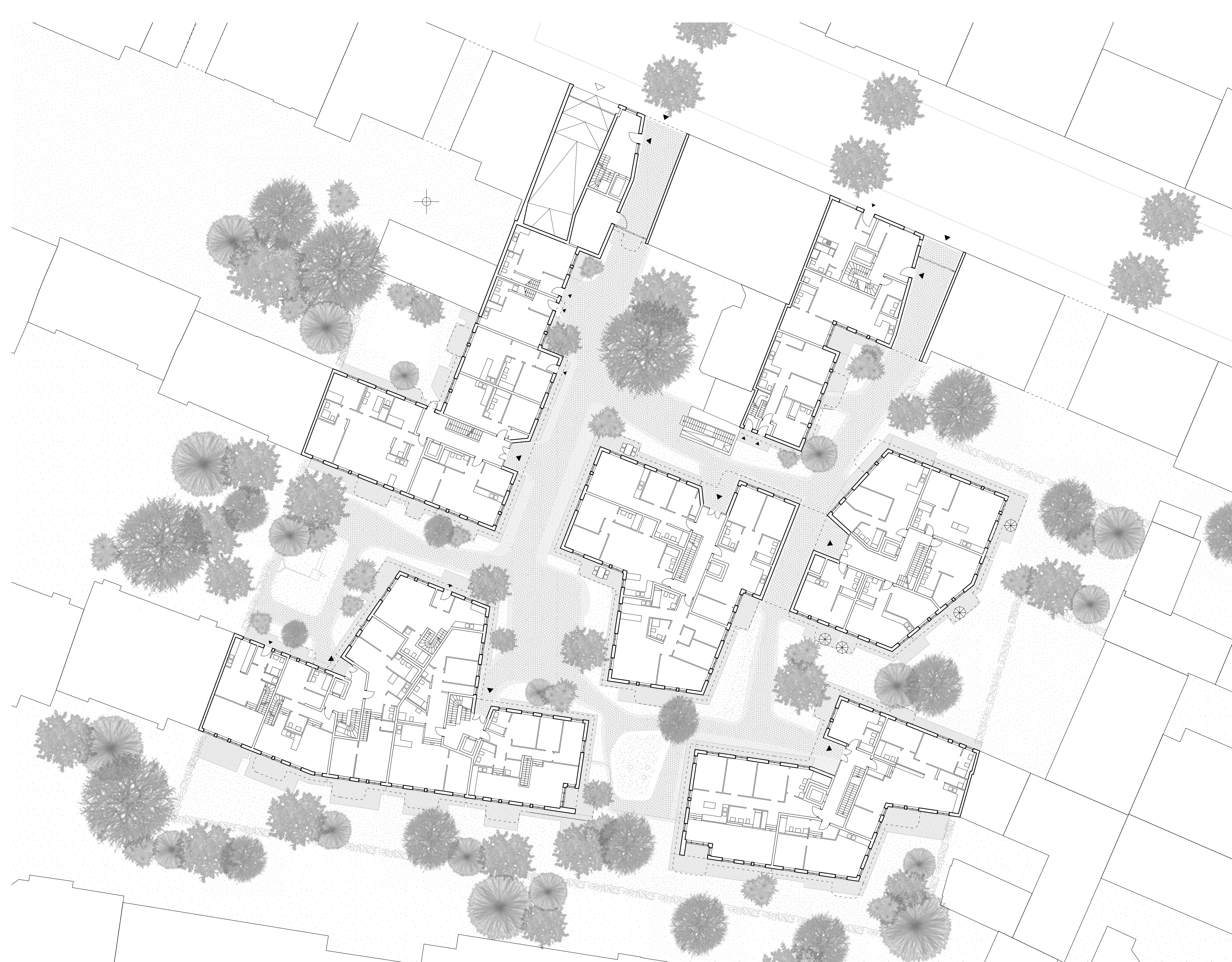
Lageplan | © Palais Mai Gesellschaft von Architekten und Stadtplanern mbH