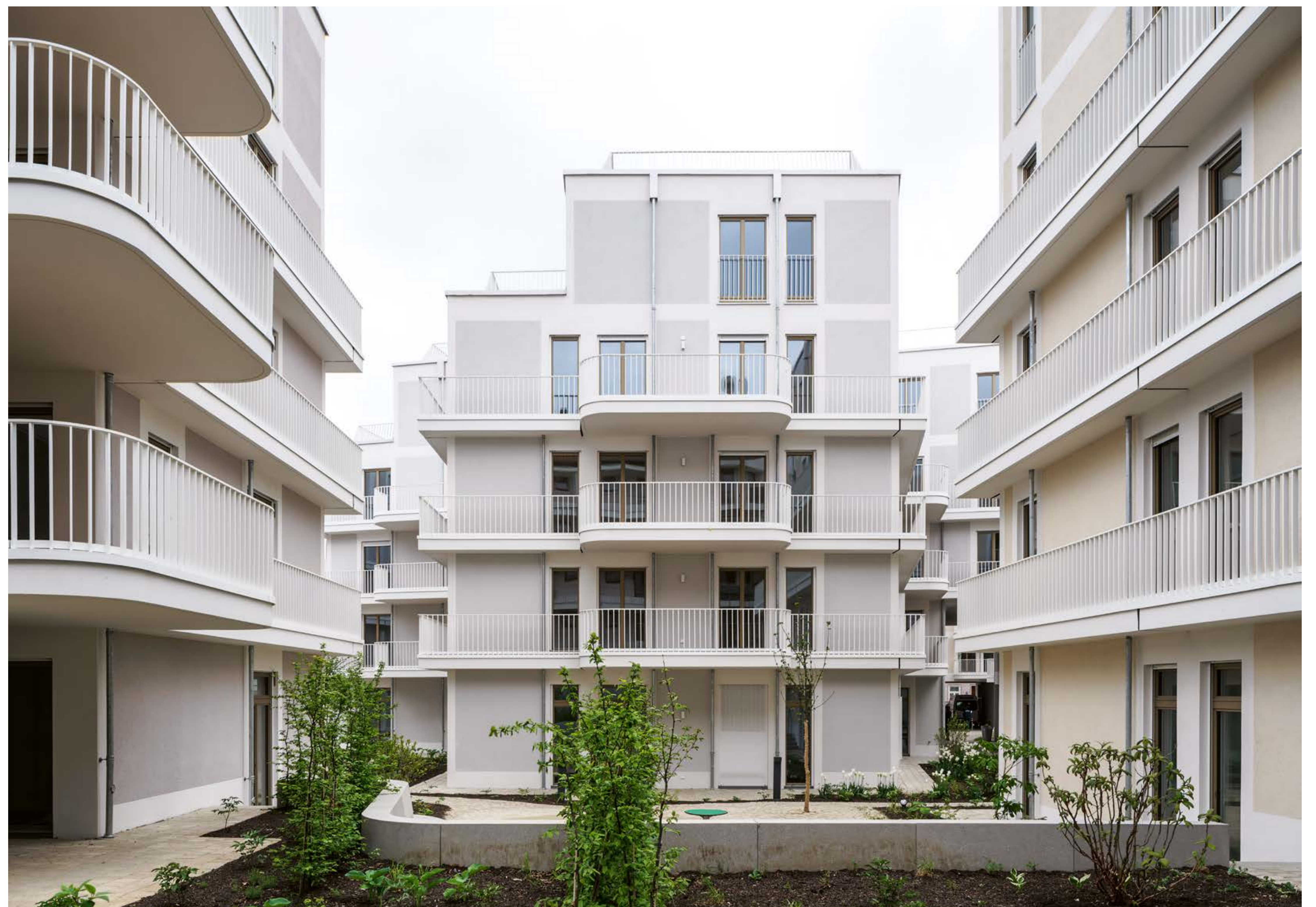
Außenansicht | © Sebastian Schels (Pk. Odessa Co)